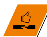
Table 1: Befestigung der AGEPAN® THD Install auf AGEPAN® OSB PUR ab 15 mm * F30-B (REI 30) / F60-B (REI 60) / F90-B (REI 90)